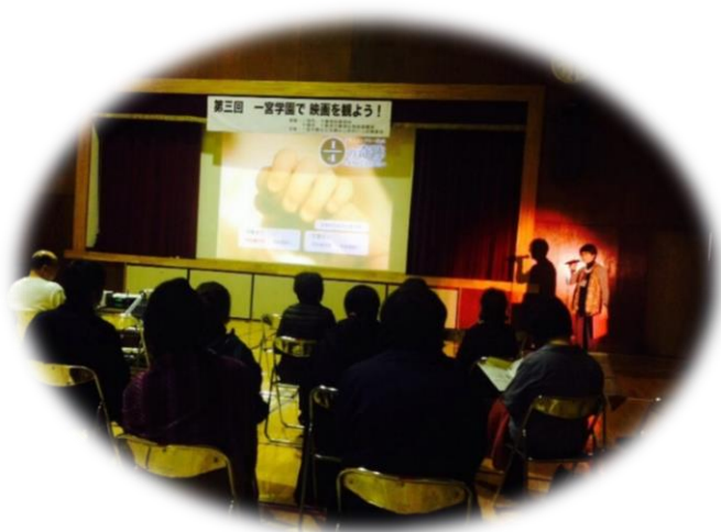
映画終了後、余韻に浸って...