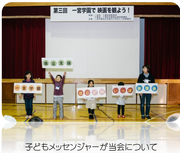
子どもメッセンジャーが当会について皆様に紹介しているところです。